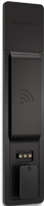
Einbaumontage Griff an der Unterseite

Wählen Sie zwischen Edelstahl Finish oder schwarzer Oberfläche mit Auf- und Einbaumontageoptionen.