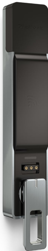
Aufbaumontage längerer ADA-Griff an der Unterseite