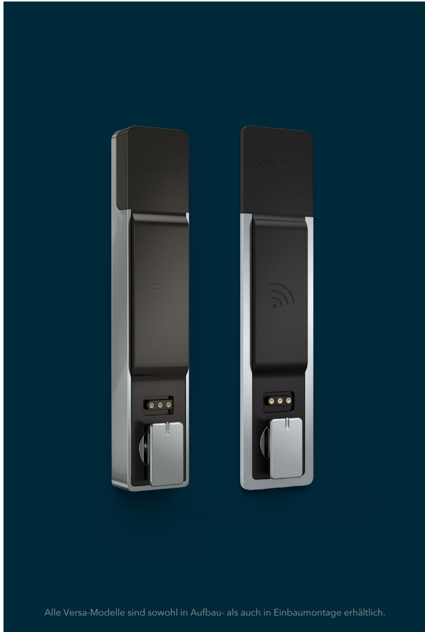
Alle Versa-Modelle sind sowohl in Aufbau- als auch in Einbaumontage erhältlich.