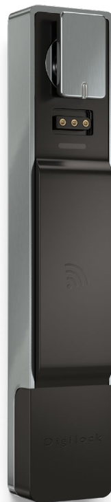
Aufbaumontage Griff oben